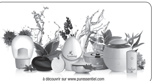
à découvrir sur www.puressentiel.com

Nous vous recommandons de ne diffuser que les mélanges pour diffusion Puressentiel® prêts à l'emploi ou des huiles essentielles 100% pures et naturelles botaniquement et biochimiquement définies de la gamme Puressentiel®. Puressentiel® vous propose des mélanges pour diffusion aux huiles essentielles 100% pures et naturelles pour profiter tout au long de l'année des bienfaits des huiles essentielles. Ils sont justement dosés et prêts à l'emploi. Idéal pour créer une ambiance olfactive agréable et profiter des nombreux vertus des huiles essentielles. Pour plus d'informations, se référer à l'étui.