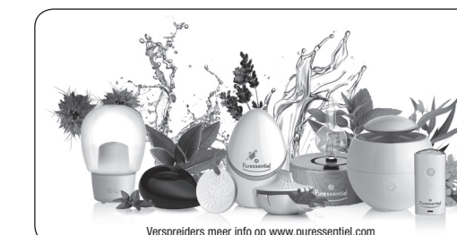
Verspreiders meer info op www.puressentiel.com

We raden u aan om alleen gebruiksklare verspreidingsmengels Puressentiel® te gebruiken of 100% zuivere en natuurlijke, botanisch en biochemisch gedefinieerde essentiële oliën van het gamma Puressentiel®.