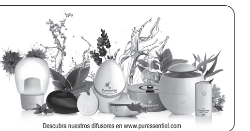
Descubra nuestros difusores en www.puressentiel.com

Le recomendamos que difunda únicamente las mezclas para difusión Puressentiel ® listas para su uso, los aceites esenciales 100 % puros y naturales definidos desde el punto de vista botánico y bioquímico de la gama Puressentiel ® . Puressentiel ® le ofrece mezclas de difusión con aceites esenciales 100 % puros y naturales para disfrutar a lo largo de todo el año de los beneficios de los aceites esenciales. Vienen dosificados y listos para su uso. Ideales para crear un ambiente olfativo agradable y disfrutar de las numerosas propiedades de los aceites esenciales. Para obtener más información, véase el envase.